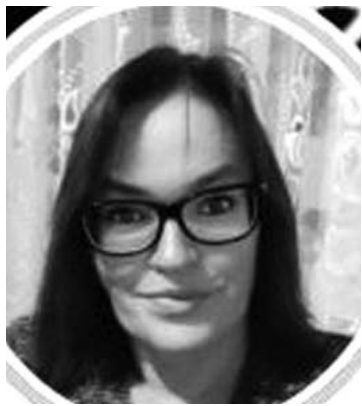
Angeliukė Ir Tiek:

Būtina juos palaikyti. Jei ne ūkininkai, neturėtume nei duonos, nei miltų, nei pieno dirbinių. Pagarba ūkininkams.