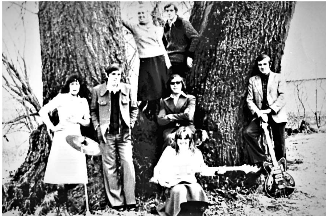
Jau 50 metų, kaip pirmą kartą ant scenos pasirodė jaunų žmonių ansamblis, vėliau pavadintas gražiu vardu „Gintaras“.