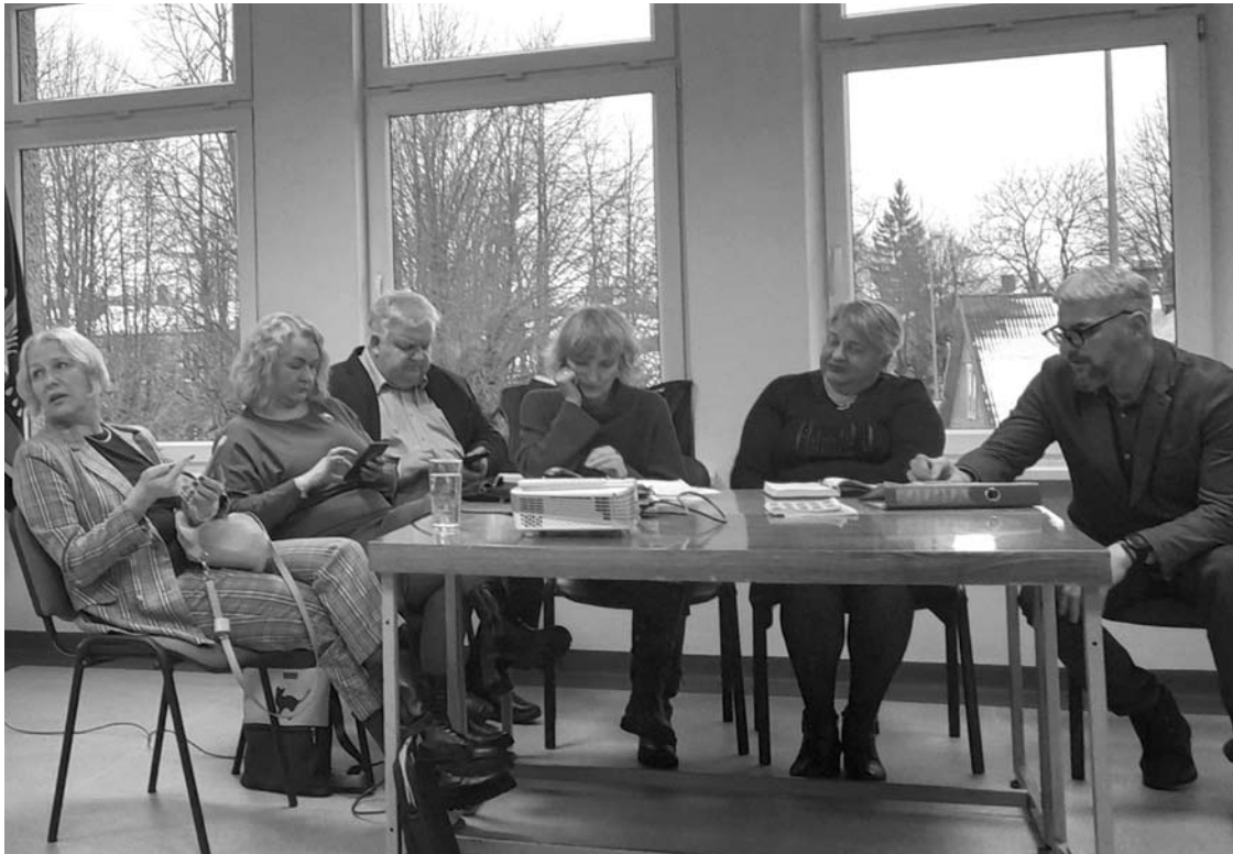
Kavarsko seniūnijoje Anykščių rajono savivaldybės darbuotojų pagal skaičių buvo tiek pat, kiek ir susirinkusių seniūnaitių.