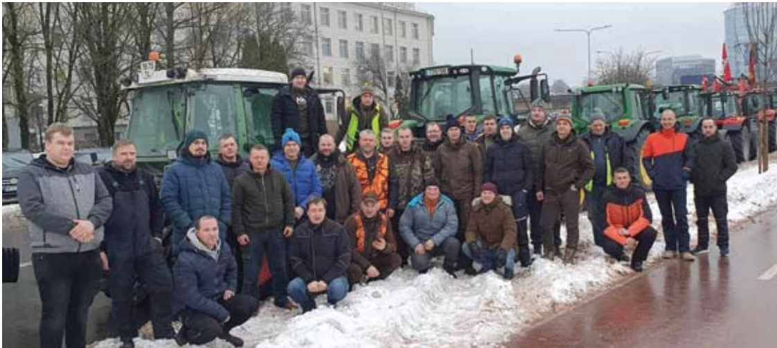
Anykščių rajono ūkininkų sąjungos nariai ir jų bendraminčiai vieningai susitelkę, siekdami konkrečių tikslų.

Tai jau antrasis ūkininkų protestų etapas – pirmasis vyko, kai sausio pradžioje visoje Lietuvoje liepsnojo ūkininkų sukrauti piketo laužai, byloję apie nepasitenkinimą šalies žemės ūkio politika. Šią savaitę visos Lietuvos žemdirbiai protesto akciją tęsia, į Vilnių suvažiavę su daugiau nei 1200 traktorių.