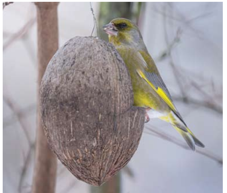
Žiemos paukštis – žaliukė – gali būti ir jūsų kaimynystėje.

Ne visada galima tvirtinti, kad pas mus žiemoja tik vietinės žaliukės – tikėtina, kad nemažai jų yra atskridusių iš šiaurės rytų. Ventės rage ir