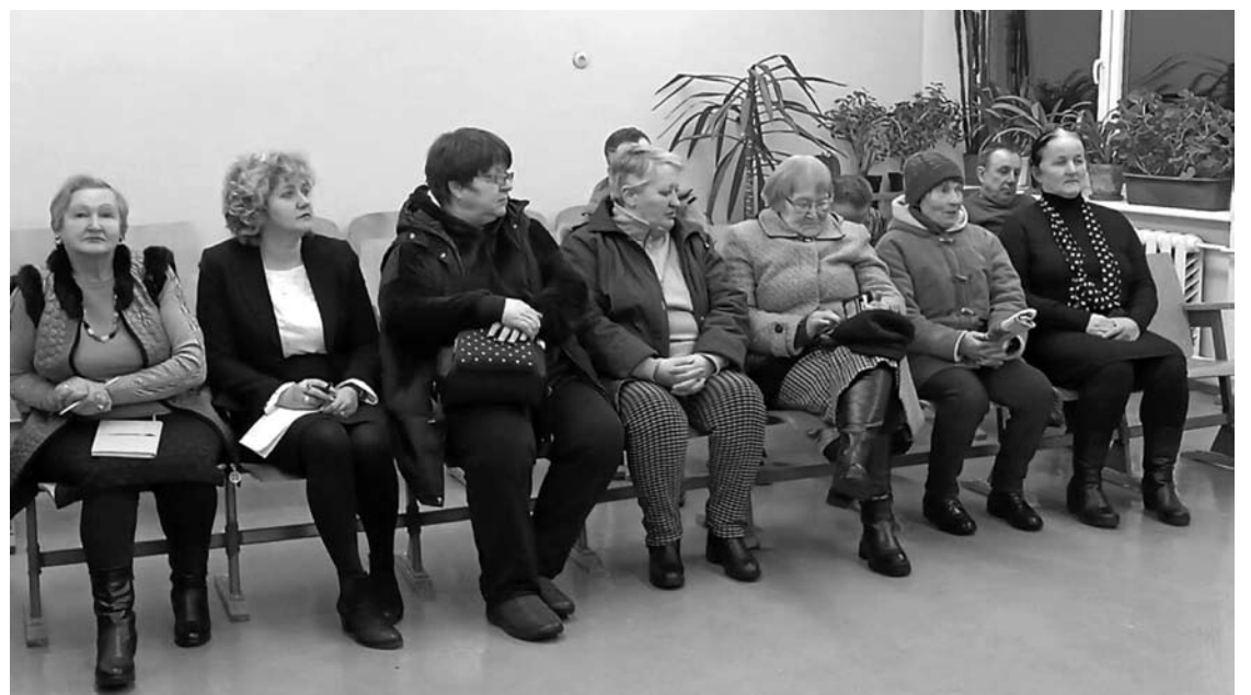
Į susitikimą su Anykščių valdžios atstovais atėję kurkliečiai domėjosi ligoninės, o ypač – vaikų ligų skyriaus likimu.